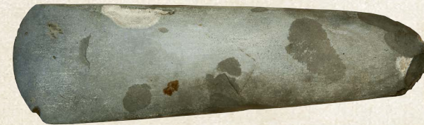
Sleben økse af flint

Der findes masser af spor efter flinthuggerens arbejde. På stenalderens bopladser finder vi mange slags redskaber og affaldsstykker. Vi finder også redskaber, der gik i stykker under flinthugningen og aldrig er hugget færdig.